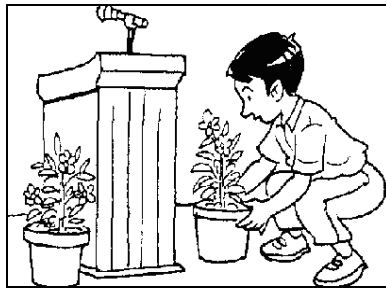
murid – pasu bunga – sekolah