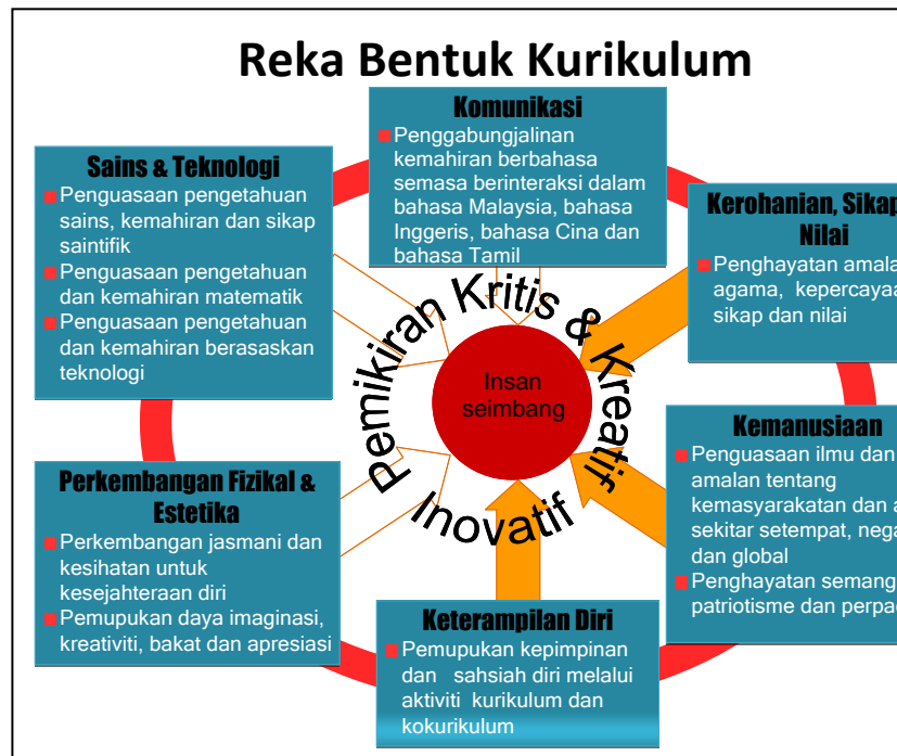
Rajah 1: Reka Bentuk Kurikulum KSPK dan KSSR

dan nilai. Disiplin ilmu dalam tunjang ini merangkumi Pendidikan Islam bagi murid Islam dan Pendidikan Moral bagi murid bukan Islam.